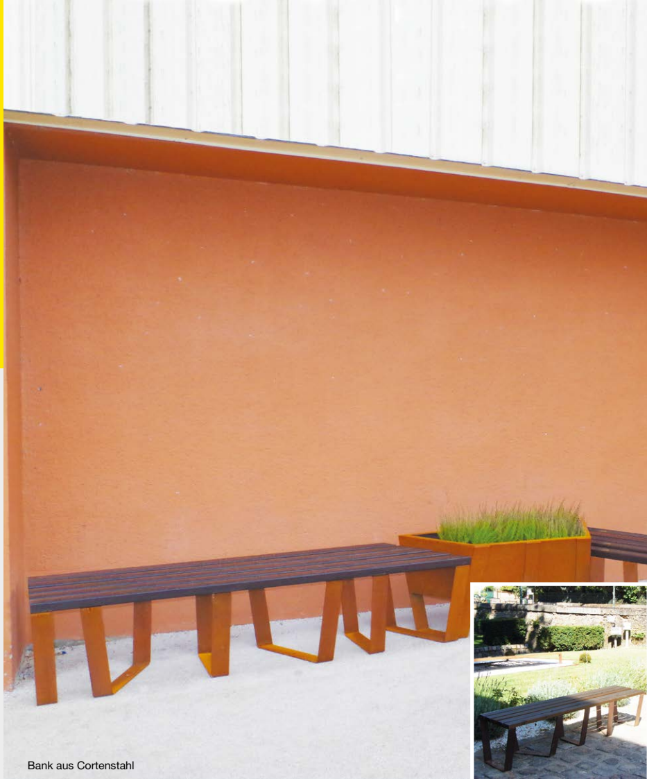
Bank aus Cortenstahl

Sitzbank mit gerade Ausführung (Bsp. Nebenstehend, auf das rechte Foto)