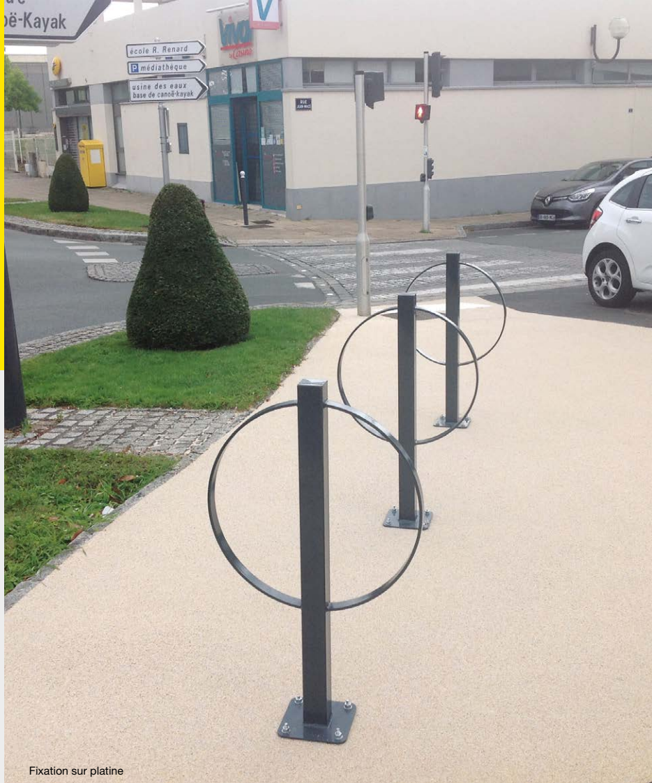
Fixation sur platine