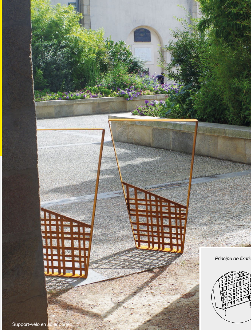
Support-vélo en acier corten