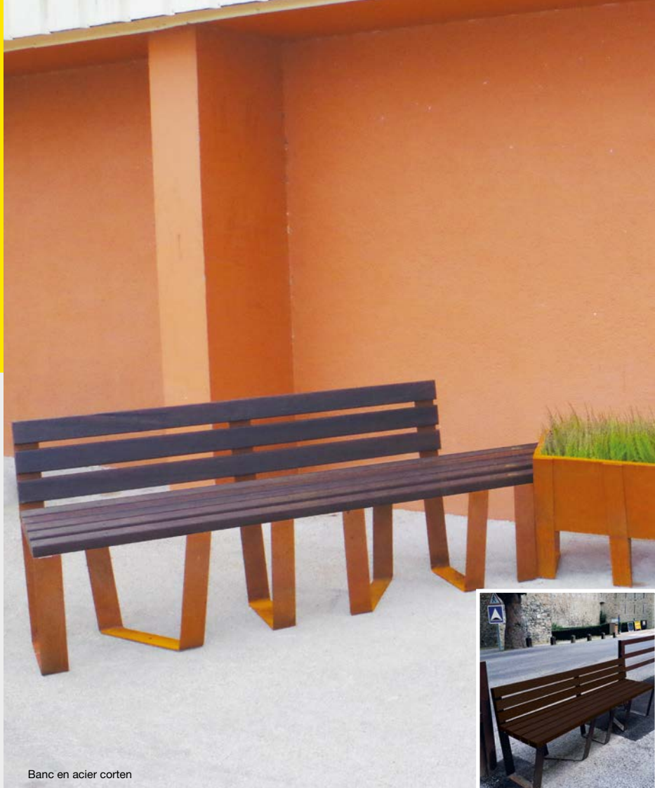
Banc en acier corten

Structure acier corten Banc avec finition droite (exemple ci-contre, sur la photographie de droite)