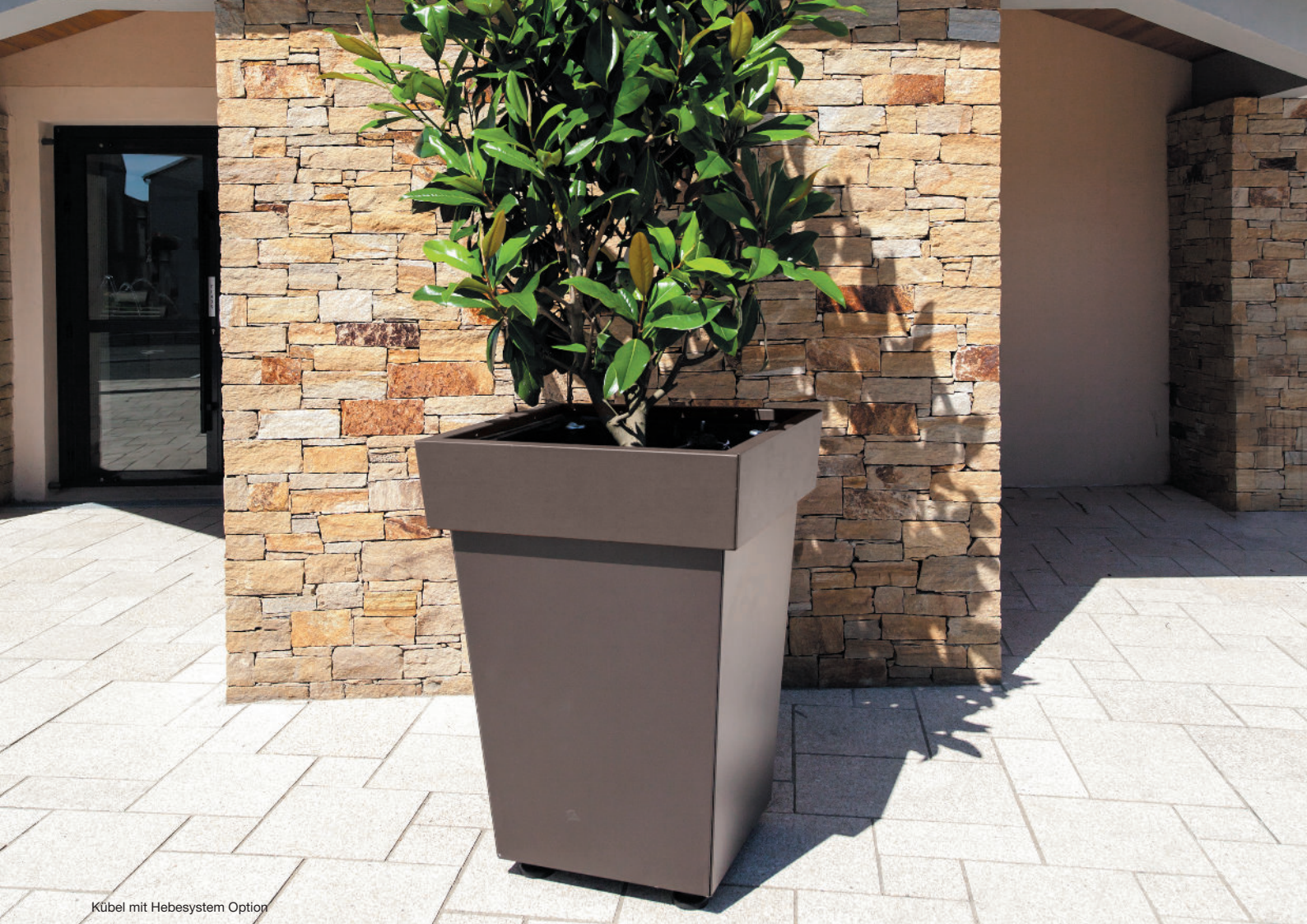
Kübel mit Hebesystem Option