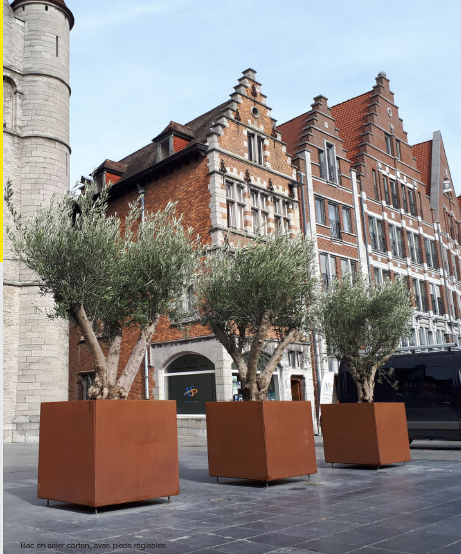
Bac en acier corten, avec pieds réglables