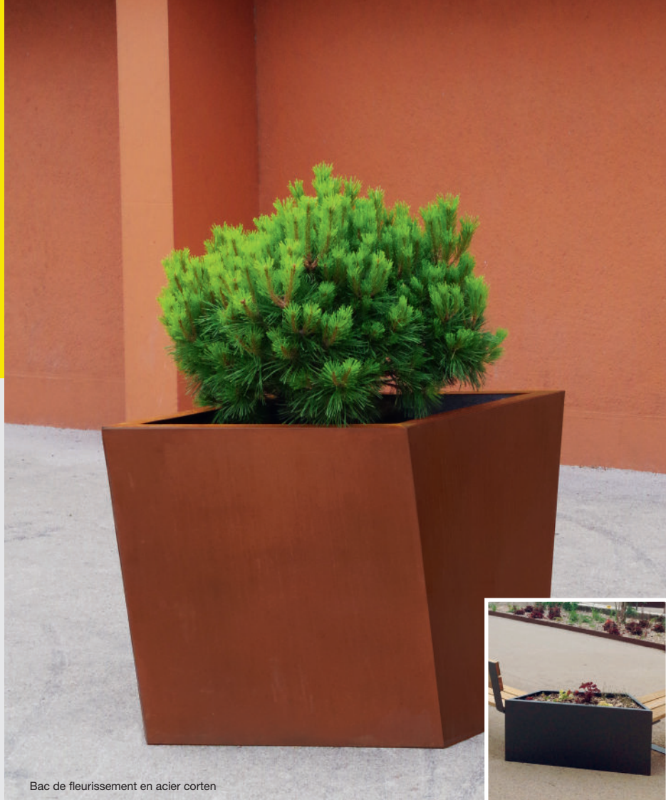
Bac de fleurissement en acier corten

Bac de fleurissement : sans fond Jardinière : avec piètements